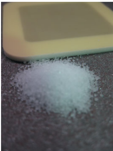
Bild 2. Maximal lösbare Salzmenge in einem Bresle-Pflaster

Das Normvolumen der Prüfkammer eines TQC-Bresle-Pflasters beträgt 2,5 ml. In Abhängigkeit von diesem Volumen und der Löslichkeit des Salzes können bis zu 892,5 mg Kochsalz in dem Pflaster gelöst werden. Dies entspricht einer Konzentration von 7,29 \cdot 10^5 \text{ mg/m}^2 Natriumchlorid. Im Vergleich mit der in den IMO-Regularen angegebenen Konzentration von 20 mg/m 2 ist das hier ein ungefährender Faktor von 36000 zwischen den beiden Konzentrationen. Die Löslichkeit der Salze hindert folglich nicht die Durchführung des Tests. Eine Konzentration von 20 mg/m 2 Natriumchlorid entspricht lediglich der Anwesenheit von 0,025 mg Natriumchlorid im Pflaster. Selbst schwerer aufzulösende Salze sind nur in einer verhältnismäßig geringen Konzentration zu finden, die hier keine Löslichkeitsprobleme darstellen. Die