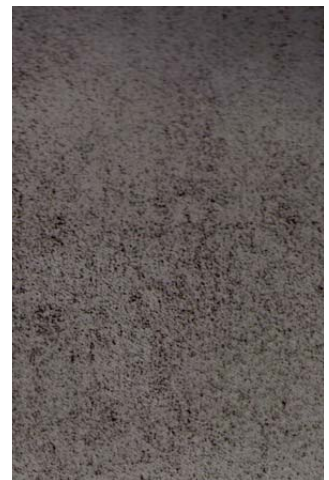
ISO-Vergleichsmuster B Sa 2½ ®