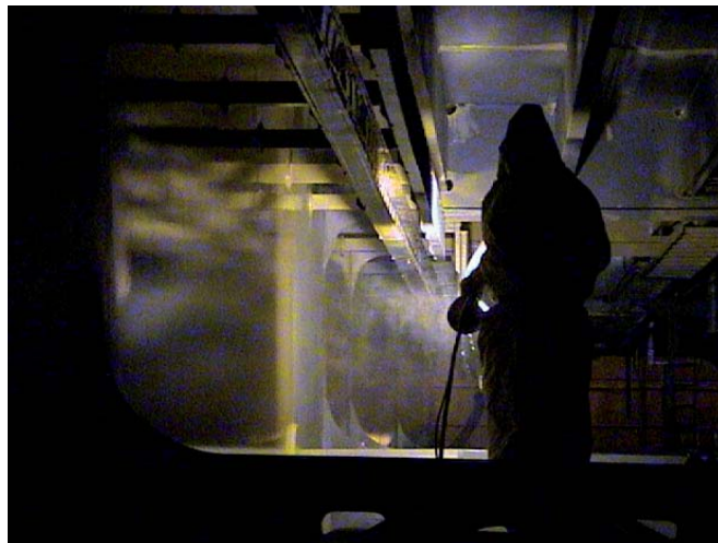
Prüfarbeiten in einer Doppelhüllen-Leerzelle

Nachfolgend werden alle Prüfvorschriften und Testmethoden im Einzelnen erläutert.