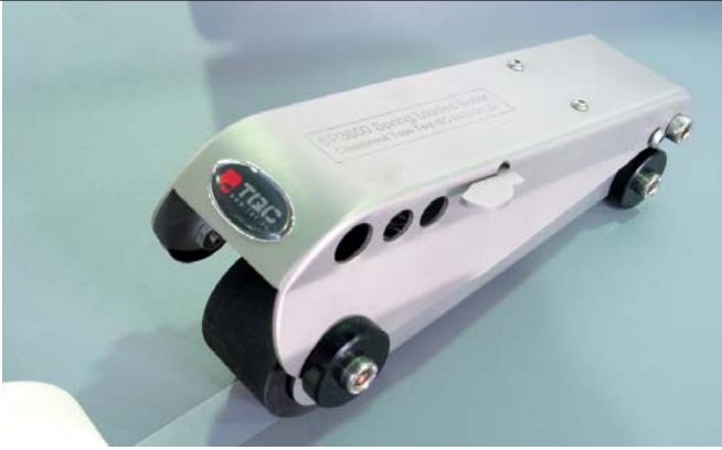
Staubtest-Anpressrolle nach ISO 8502-3° Teil 2