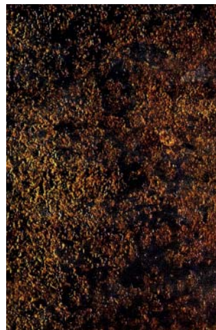
Rostgrad B, ISO 8501-1 ®